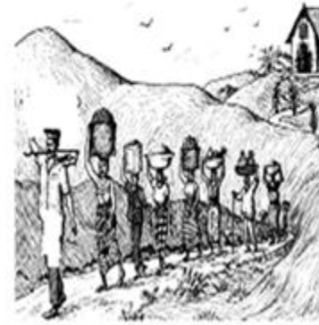
maabí záatha assúgúéqi