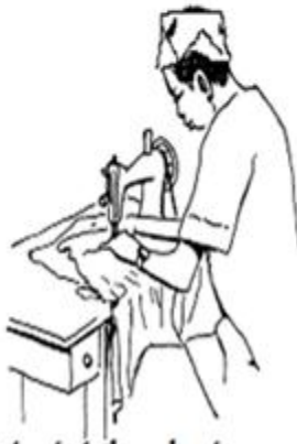
maabá góri tha almágana